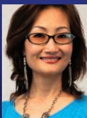
胡彤 女高音歌唱家