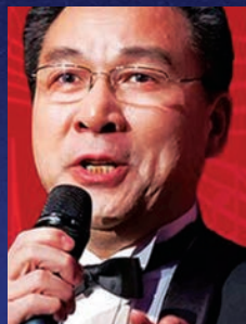
韦桂林 特邀著名抒情 男高音歌唱家