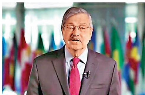
大家好！我是特里·布蘭斯塔德。我為擔任美國新任駐華大使感到很高興。