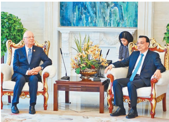
中國國務院總理李克強（右）26日會晤世界經濟論壇執行主席克勞斯·施瓦布。

本屆夏季達沃斯論壇吸引了來自80多個國家的2,000多位嘉賓參與，人工智能、機器人話題成為焦點議題。據了解，普華永道、埃森哲等國際服務、諮詢公司將於會議期間發佈多份研究報告，集中解答全球關注的人工智能對經濟發展的影響。此外，本屆論壇還將與香港科技大學聯合舉辦會議，聚焦“無人機經濟的未來”議題。