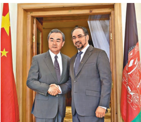
中國外交部長王毅（左）會晤阿富汗外長拉巴尼。新華社