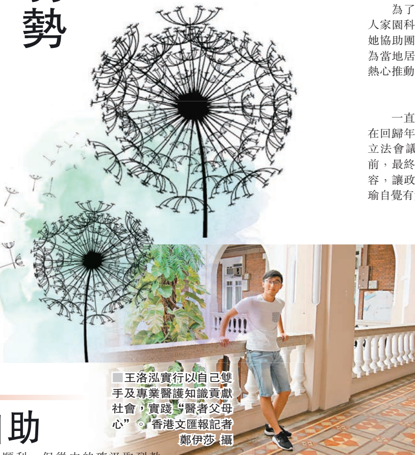
■王洛泓實行以自己雙手及專業醫護知識貢獻社會，實踐“醫者父母心”。