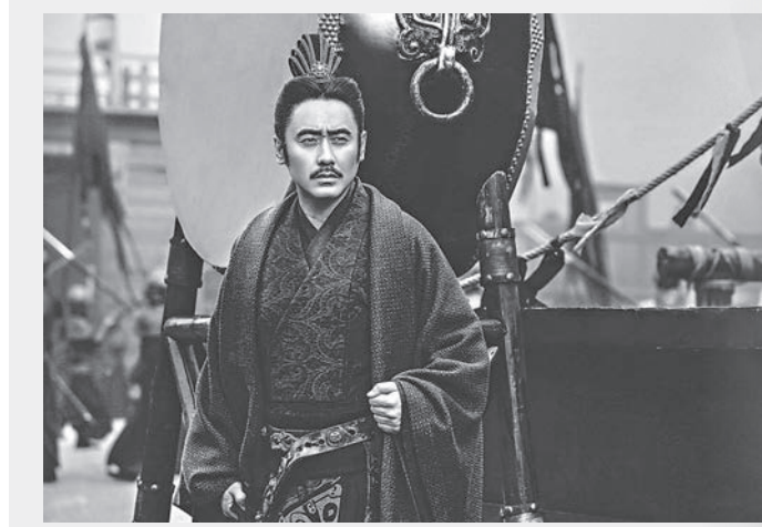
吳秀波在《軍師聯盟》中詮釋司馬懿。圖／資料照片

吃素，信佛，讀經，讓他學會訓練自己的無分別心，戰勝自己的欲望。吳秀波有自己獨特的人生感悟，他說：「當你的欲望大到撐破了這個籠子，你會以為你自由了，但慢慢地你會發現，外面還有一個更大的籠子。只有縮小欲望，才能在籠子中安逸自在。如果能去掉更多的欲望，讓自己變得更小，就能從籠子的縫隙鑽出來，得到相對的自由。」吳秀波說：「人生首要的態度是去除所謂落魄與風光的分別心。」這幾年，他在公衆場合做的最多的一個動作就是靜心合掌，人前保持謙卑。