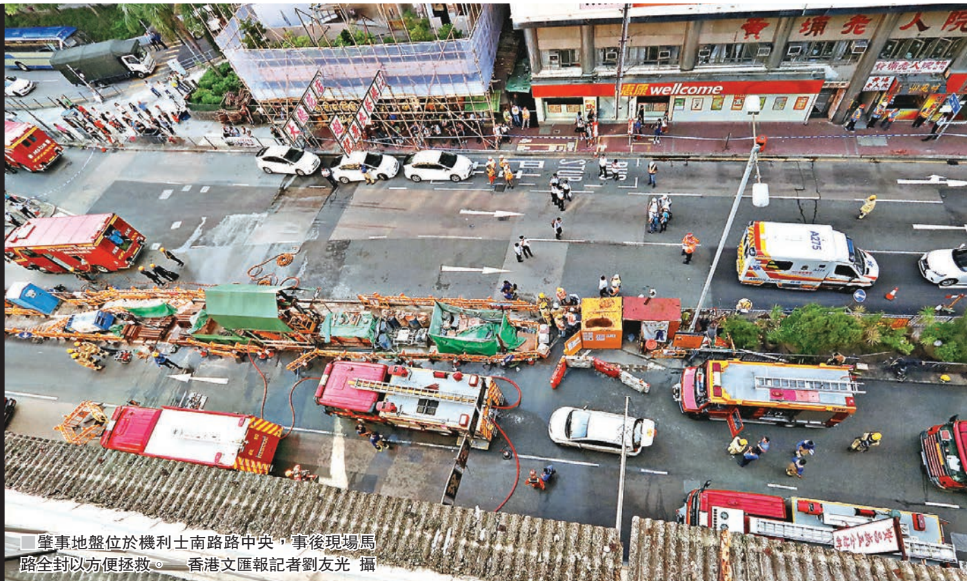
肇事地盤位於機利士南路路中央，事後現場馬路全封以便拯救。