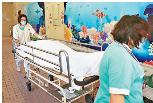
■首先救出的工人送院證實不治，遺體昇送殮房。

事發後中電、勞工處、渠務處及隧道工程承辦商均有派員到場了解情況。中電署理輸電及供電業務部高級總監何耀基表示，已暫停所有同類工程，並全力配合當局調查肇因。他強調，工程已做足安全措施及風險評估，地底及地面亦有同事支援。承辦商金城營造行政總裁王紹恆對事故感到難過，向家屬致以深切慰問，已即時向3名死者的家庭各發放10萬港元現金應急。