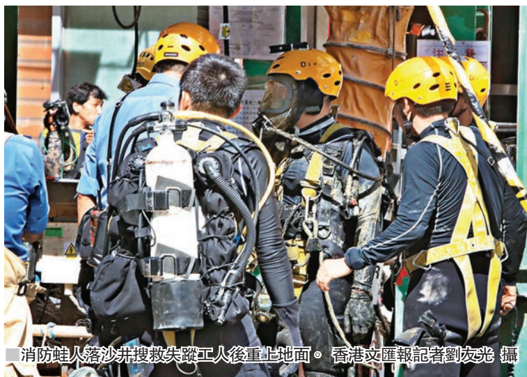
消防蛙人落沙井搜救失蹤工人後重上地面。