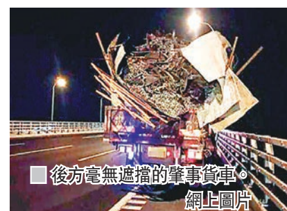
■後方毫無遮擋的肇事貨車。 網上圖片

擋。貨車司機說，上高速時，他用鋼板和繩索將貨物捆牢，可不知道為何上高速後，貨物掉落下來。