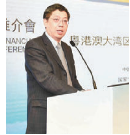
巴曙松指香港金融市場可作為中國經濟和粵港澳大灣區走出去的門戶市場。

香港文匯報訊 據悉，自茅台公佈漲價方案後，各大券商再次紛紛調高貴州茅台的目標價，據Wind資訊統計，截至1月12日，有7家券商預計貴州茅台估值將突破萬億元。 行業板塊中，僅保險、銀行、民航機場飄紅，保險板塊大漲超過3%，中國太保漲了逾5%，新華保險、中國平安升逾4%，中國人壽漲3%。銀行板塊升幅錄得近1%，領漲的平安銀行升近5%，工商銀行、農業銀行、建設銀行、中國銀行等四大行漲幅都超過了2%。由於大盤股造好，上證50指數15日領跑，不但未有下跌，反而還上行1%。 近期投資者熱捧的區塊鏈板塊，15日開市依然大幅下探，低開逾3%，10分鐘後跌幅又進一步擴大至4%，明顯令做多動能有所收斂。另外，國產芯片、高送轉板塊大跌5%，航天航空、5G概念、北斗導航、電信運營、稀土永磁、移動支付、煤炭也重挫4%，區塊鏈板塊已連續兩個交易日走弱，15日又跌去了3%。 滬指終結11連陽 滬綜指早市平開後，受區塊鏈板塊壓制，快速向下，但由於保險、銀行股積極護盤，股指在3,410點附近獲得支撐，開始震盪拉升。午後，滬深兩市持續下探，不過滬市相對抗跌。截至收市，滬綜指報3,410點，跌18點，或0.54%；深成指報11,307點，跌154點，或1.35%；創業板指報1,732點，跌53點，或2.97%。兩市共成交5,857億元，較前一交易日放量近三成。 貴州茅台股價早盤飆升到799元，市值一度突破萬億大關，但受大市拖累節節敗退，最終收跌0.39%，報785元，市值錄得9,866億元，衝關未果。