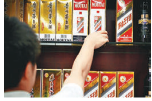
貴州茅台股價早盤飆升到799元人民幣，市值一度突破萬億大關。資料圖片

2017年全年人民幣上漲幅度為6.72%。招商證券首席宏觀分析師謝亞軒認為，近期全球經濟強勁的氛圍發酵，商品價格走強，而且政治環境亦有所改善，這導致全球央行可能加速收緊貨幣政策的預期驟升。在此條件下，看空美元的觀點很容易成立，看多美元的觀點很難立足，而這樣的預期已在美元指數走強上有所體現。 興業銀行首席經濟學家魯政委亦認為，美匯指數大幅下挫帶動了人民幣相對美元升值，再加上春節前剛性結匯需求、購匯盤觀望使得人民幣存在短線繼續升值空間，若美匯指數短期繼續貶值，人民幣升值幅度可能加大。 分析料市場看空美元 2018年新年以來人民幣匯價漲勢如虹，短短半個月時間最高漲幅一度超過1.2%，而