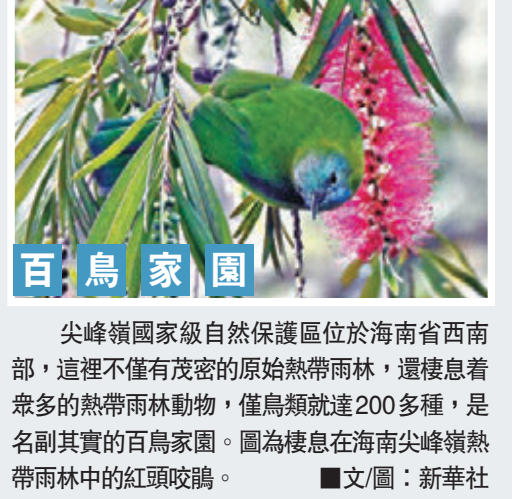
尖峰嶺國家級自然保護區位於海南省西南部，這裡不僅有茂密的原始熱帶雨林，還棲息着眾多的熱帶雨林動物，僅鳥類就達200多種，是名副其實的百鳥家園。圖為棲息在海南尖峰嶺熱帶雨林中的紅頭咬鵲。 ■文/圖：新華社

坑中型墓6座，小型墓5座；馬坑5座，車馬坑1座，祭祀坑1座，灰坑8座。出土青銅車器、玉器等文物3,000餘件。 甲骨文在姚河塬商周遺址的發現是商周考古領域的重大發現之一。通觀內地出土甲骨文的遺址，均具有都邑性質，這也印證了姚河塬遺址的級別較高、與周王朝保持着密切的聯繫，對判斷整個遺址屬西周早期封國性質這一論斷提供了強而有力的支撐。 ■香港文匯報記者 王尚勇 寧夏報道