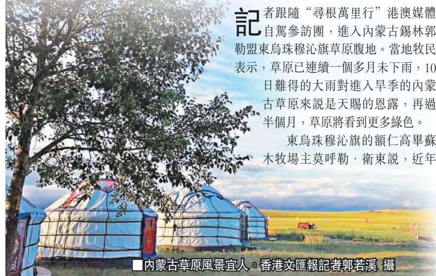
■內蒙古草原風景宜人。

記者跟隨“尋根萬里行”港澳媒體自駕參訪團，進入內蒙古錫林郭勒盟東烏珠穆沁旗草原腹地。當地牧民表示，草原已連續一個多月未下雨，10日難得的大雨對進入旱季的內蒙古草原來說是天賜的恩露，再過半個月，草原將看到更多綠色。